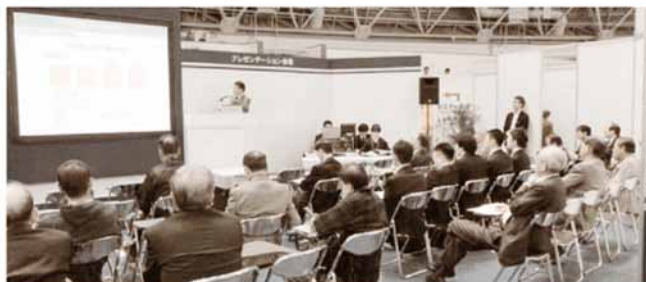
びわ湖環境ビジネスメッセプレゼンテーション

企業・大学等の保有する「木質バイオマス」を中心とした無機・有機化学等に係る、技術・ノウハウ・人材を活用しながら、高付加価値の化学製品「ファインケミカルズ」等を製造する広域連携システム（バイオマス・ファインケミカル・リファイナリーシステム）の構築と、高付加価値ファインケミカルズ製品の事業化を目指しています（中国経済産業局補助事業）。バイオマスのマテリアル・ケミカル等の高付加価値利用に係る新事業の創出・拡大に向けた機運の醸成・ネットワークの拡大・販路拡大等を目指した勉強会・セミナー・展示会への出展支援活動などを実施しています。