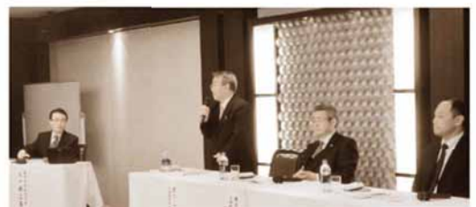
中国地域ニュービジネス大賞受賞企業経営者による パネルディスカッション