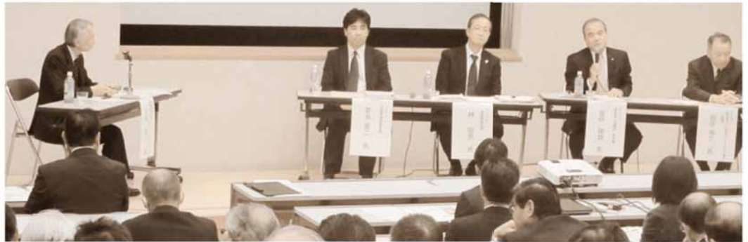
トークセッション