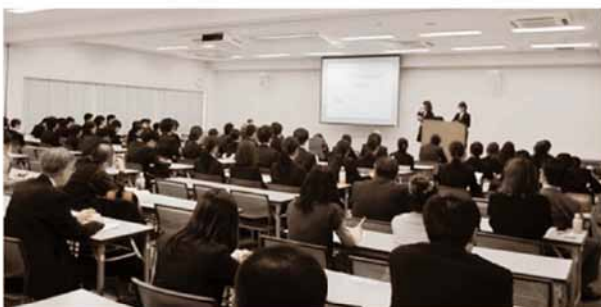
プレゼンテーション中の学生

＜魅力発信グランプリ＞（平成25年11月16日・17日、於/RCC文化センター）