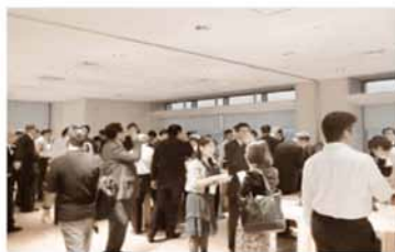
中国電力・中国経済連合会