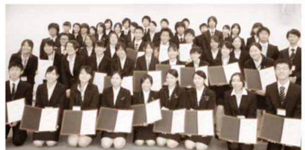
受賞および参加学生のみなさん