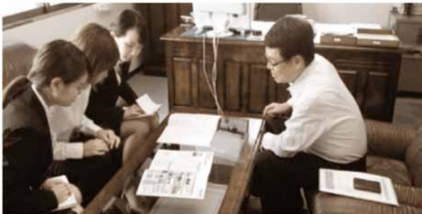
経営者インタビュー

第3回の今年は、中国5県で参加企業35社。参加校は11大学、1高等専門学校（参加学生は98名）と年々増えています。参加企業からは、「社員が改めて自社の良さを考えるよい機会になった」「若い人が考える会社の魅力について答えが見えた」、学生からは「中小企業の強みや面白さがわかった」「社長や社員にお会いして、商品やサービスへの想いを知り地元の企業に興味を掻きた」などの感想をいただき、企業と学生がWin-Winの関係で作る『新しい形のインターンシップ』と大学からも評価を受けています。