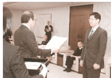
松井市長から表彰状授与