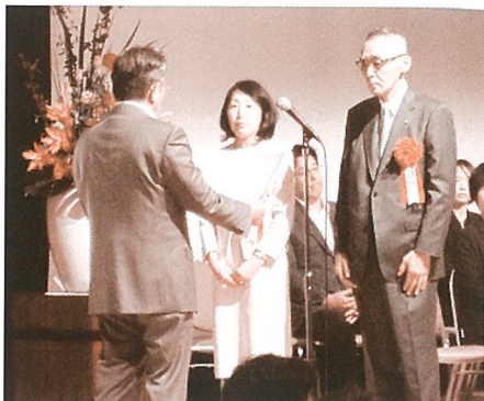
大賞を受賞した福德技研(株)様

※第26回中国NBC大賞受賞企業の詳細内容 ⇒ http://nb.cnbc.or.jp/2018_26/