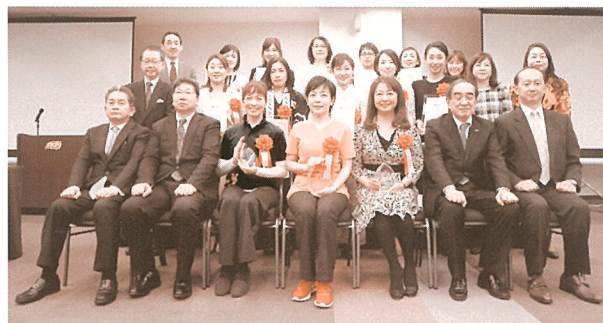
第1回コンテスト受賞の皆さまと 共催4団体の代表者

※第2回中国地域女性ビジネスプランコンテスト SOERUの詳細内容は弊協議会ホームページ等をご覧ください。(近日中に掲載予定)