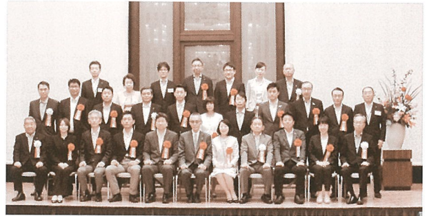
受賞企業の皆さま、弊協議会正副会長

まもなく第27回の募集活動を始めます。引き続き皆さまのご支援・ご協力をお願いします。