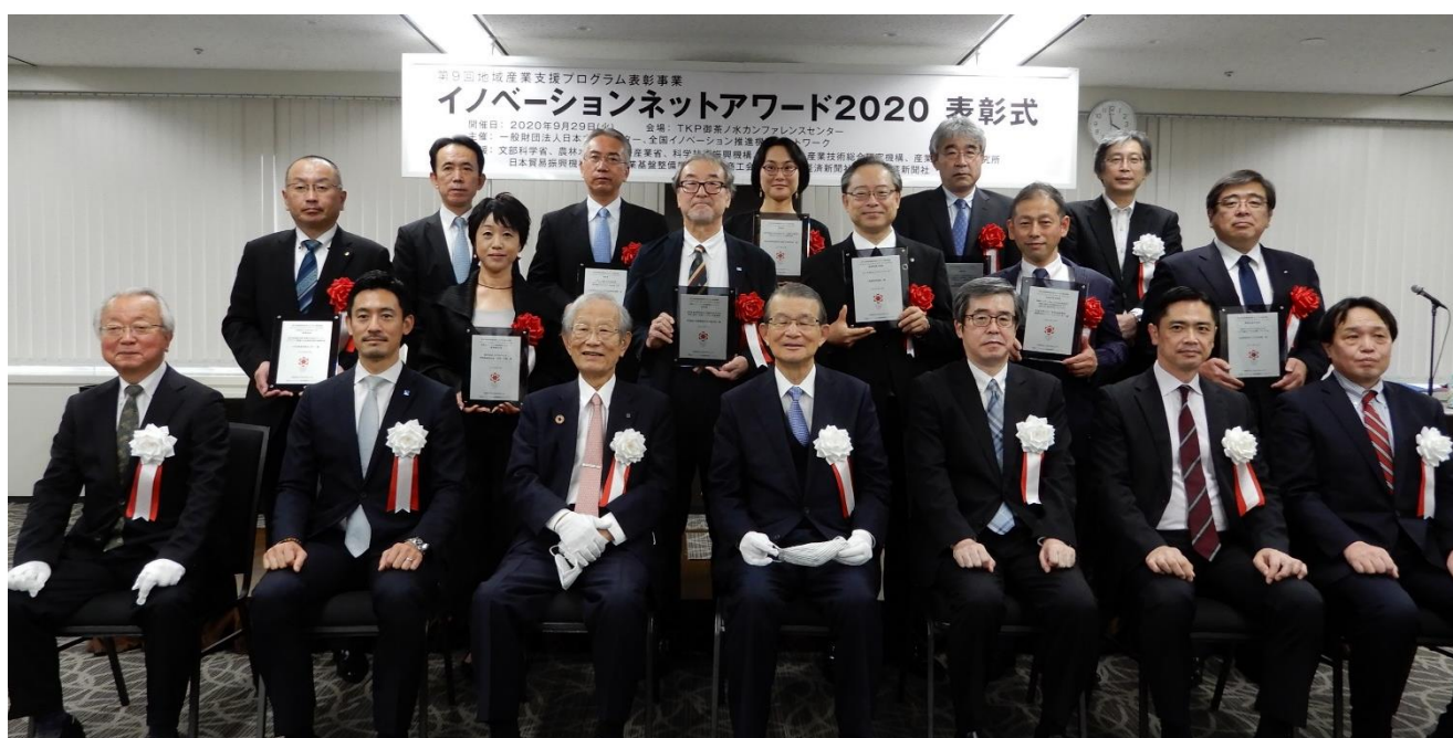
イノベーションネットアワード2020表彰式での記念撮影 (記念撮影時のみ、マスクを外しております)

地域の中小企業による新事業および新産業創出などを促進し、地域産業の振興・活性化に優れた成果を上げている「地域産業支援プログラム」を表彰します。