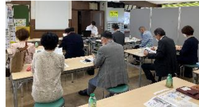
日本果実工業(株)萩工場 様