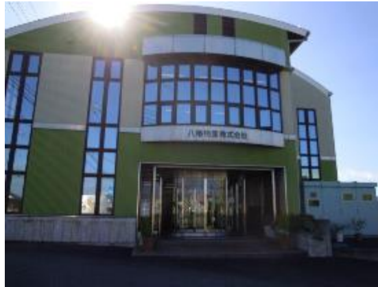
第8回大賞受賞 八幡物産 (株)