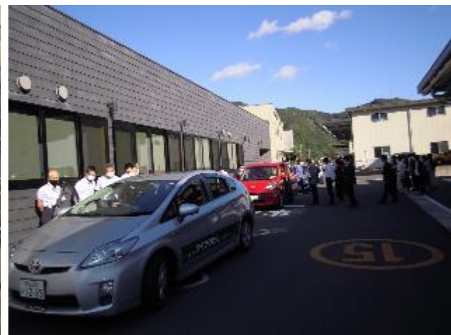
アイアクセルの試乗体験