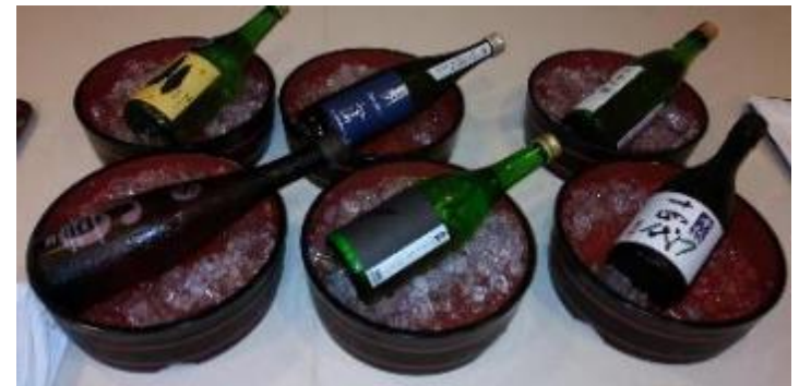
おすすめの日本酒を持ってきていただきました。