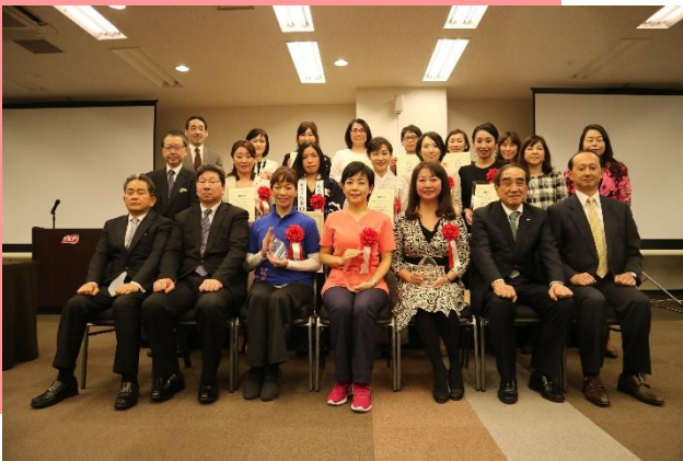
第1回SOERU表彰式 2018年1月25日