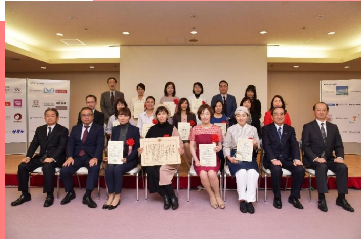
第2回SOERU表彰式 2018年12月10日