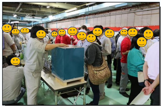
からくり改善くふう展