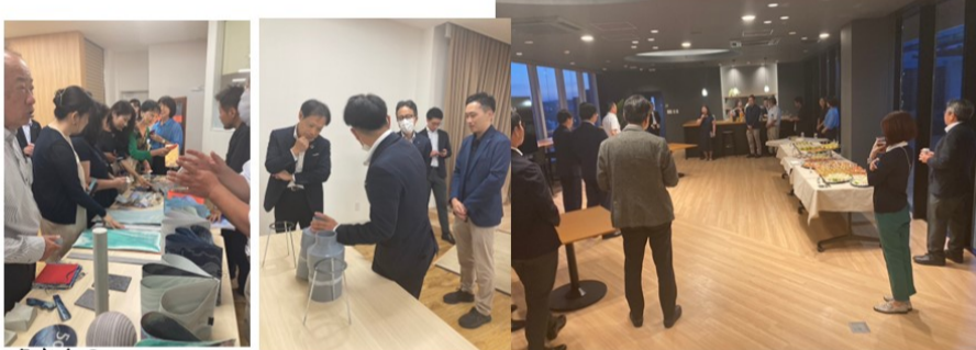
セイシヨクさんの NUNOUS (新素材) ご紹介