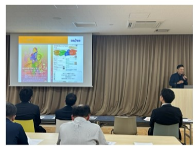
セイシヨクさん、大和クレスさんの講演はとてもわかりやすかったです。